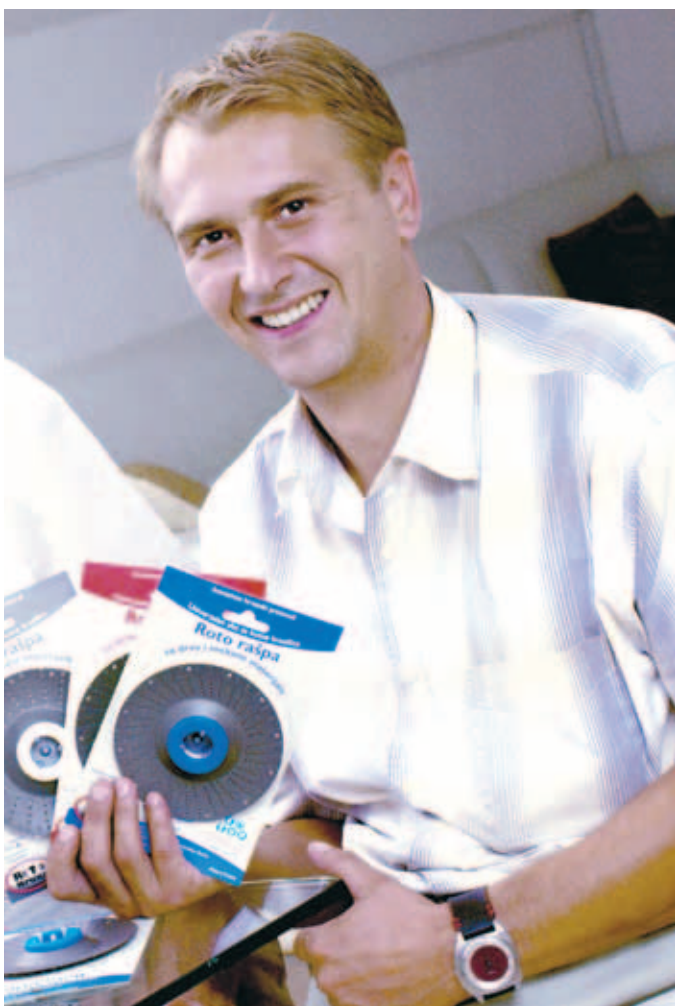
pojavljivanje na inovatorskim izložbama nepotrebno - jer se